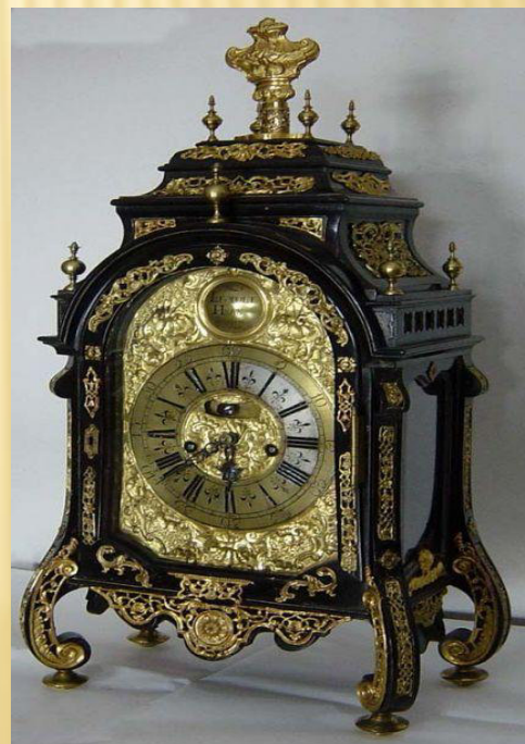
Barokní stolní hodiny, zámek Dačice 18