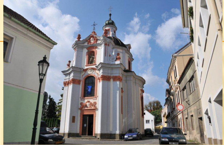
Kostel sv. Jiří, Litoměřice