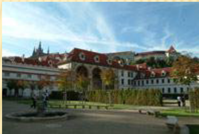
Valdštejnský palác, Praha 13