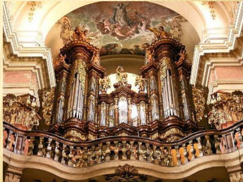
Barokní Svatojakubské varhany