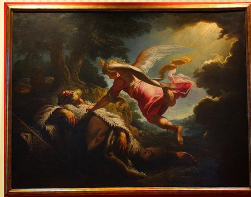
Sen proroka Eliáše, Petr Brandl 25