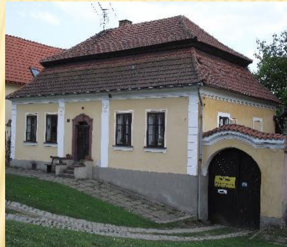
Ondřejovská fara 8