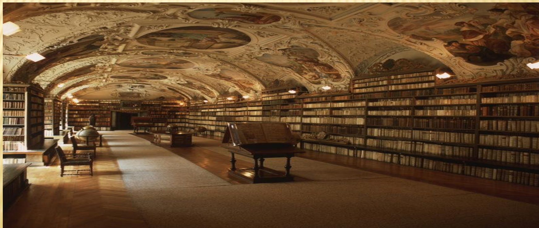
Knihovna v Klementinu, Praha