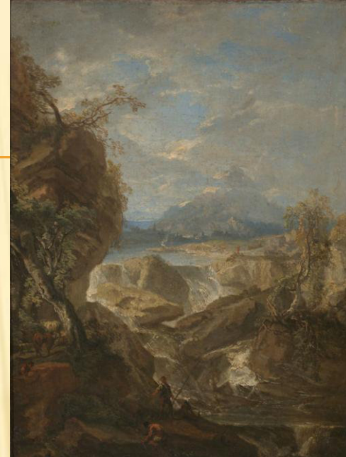
Krajina s rybáři, Václav Vavřinec Reiner 26