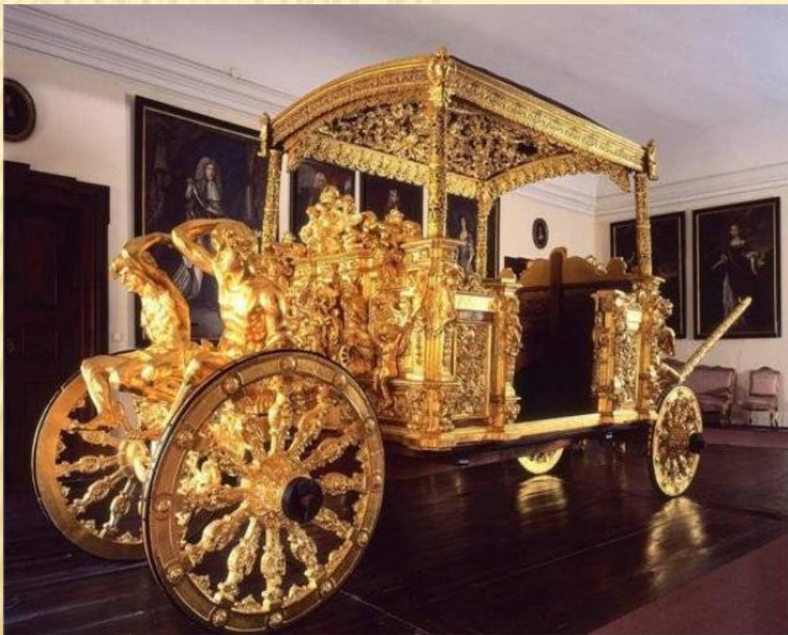
Zlatý eggenberský kočár, Český Krumlov 16