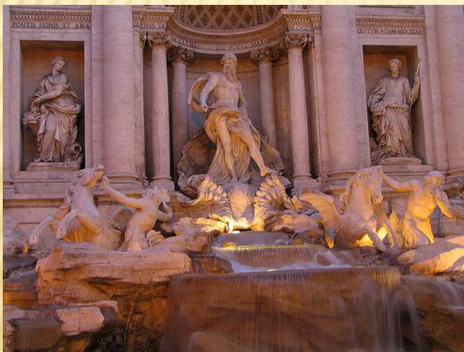
Fontána di Trévi, Itálie, Řím