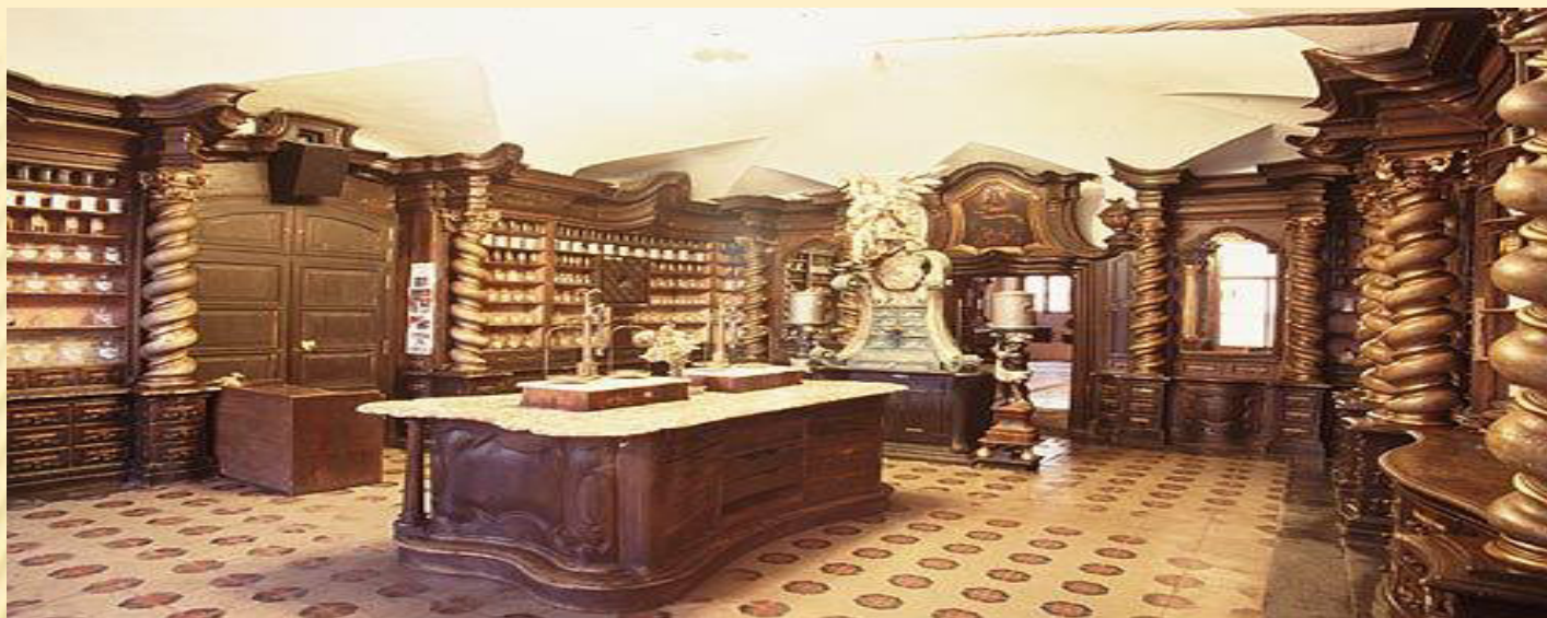
Barokní lékárna U bílého jednorožce, Klatovy