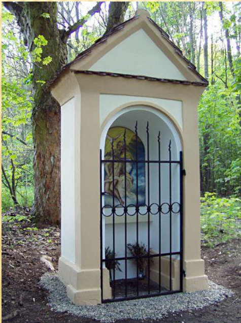
Kaplička, Žízníkov 7