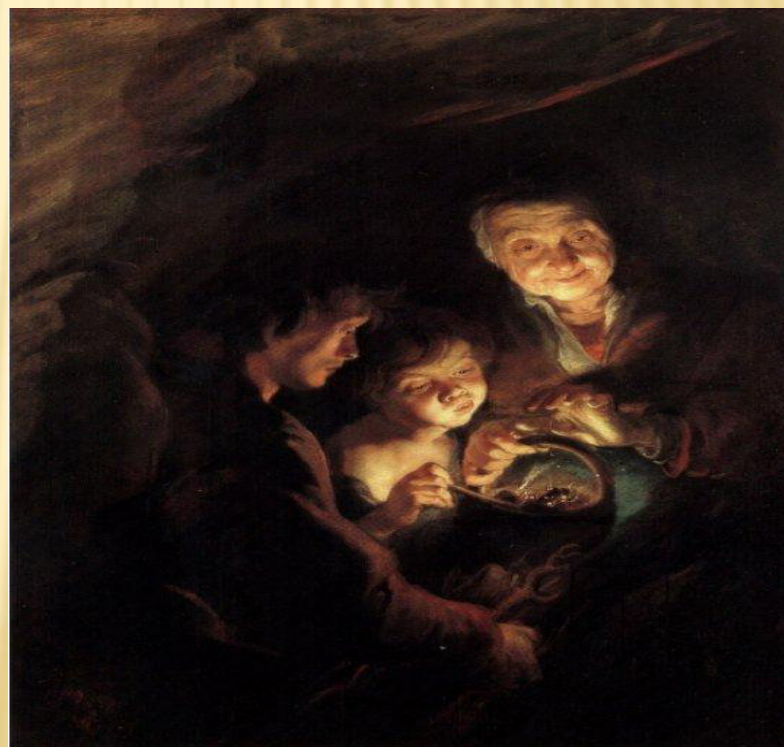
Stařena s rozžhaveným uhlím, Peter Paul Rubens 22