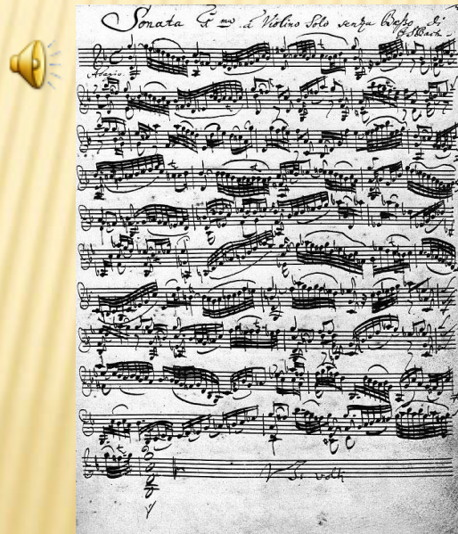
Houslová sonáta, Bachův rukopis 30