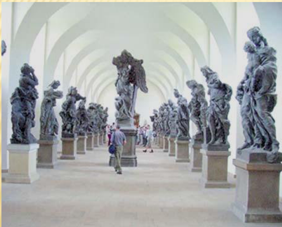
Ctnosti a neřesti, zámek Kuks