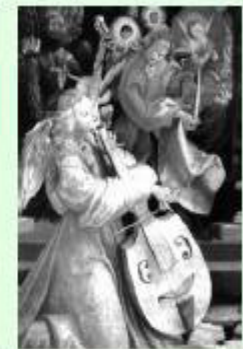
Viola de gamba