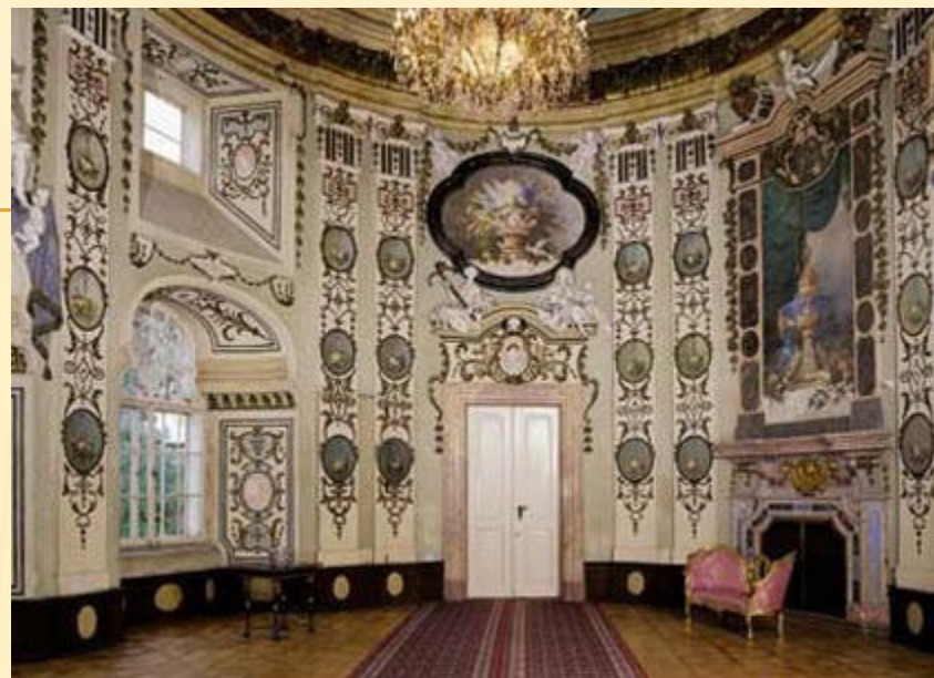
Zámek Ploskvice 10