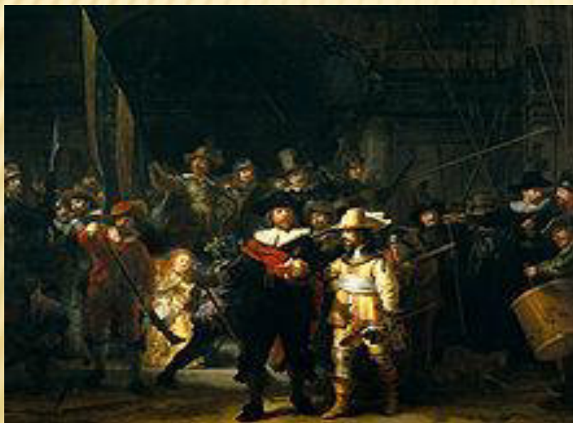
Noční hlídka, Rembrandt van Rijn 21