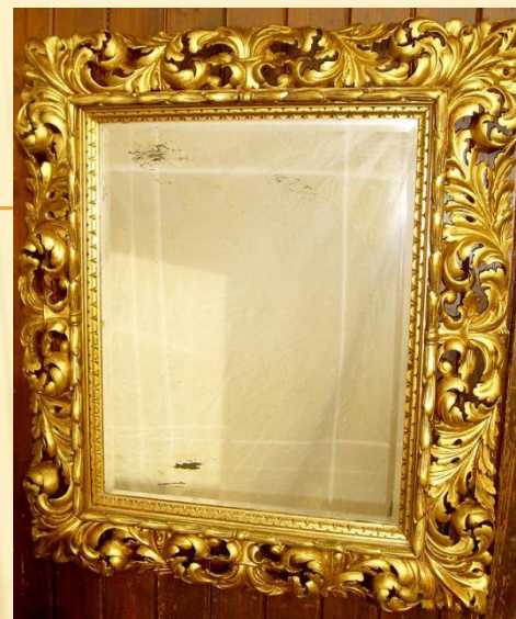
Zlacené barokní zrcadlo 17