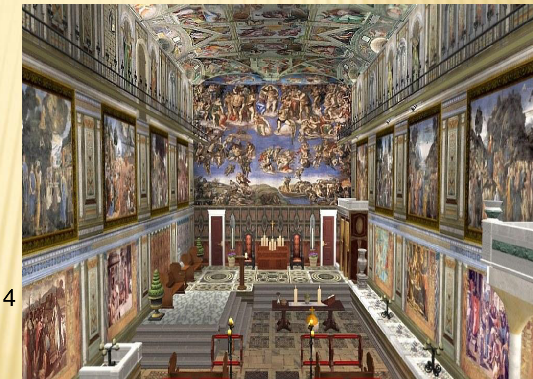
Sixtinská kaple, Vatikán, Řím