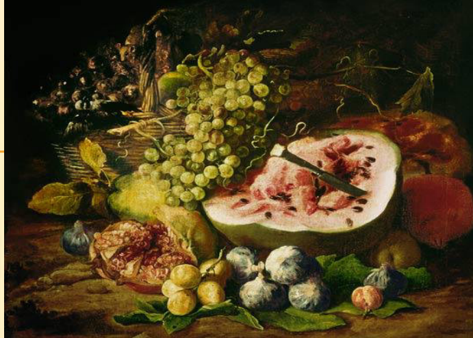
Zátiší s ovocem, Frans Snyders 23