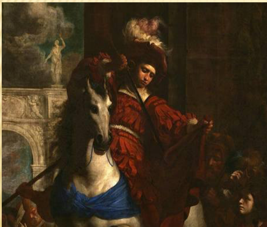
Sv. Martin, Karel Škréta 24