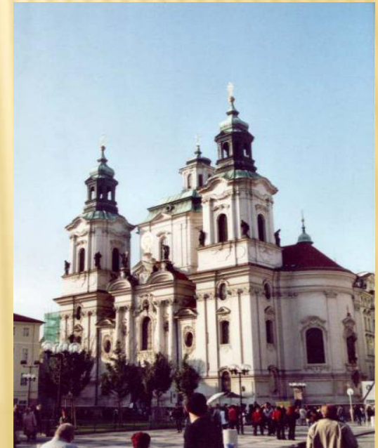
Kostel sv. Mikuláše, Praha 9