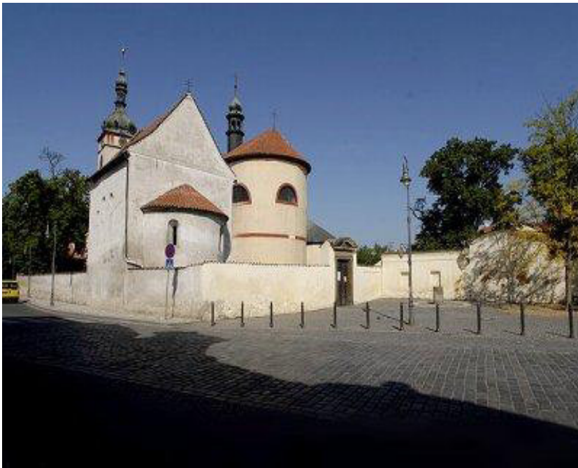
Bazilika sv. Václava

http://www.navstevapapeze.cz/d/stara-boleslav-2.jpg