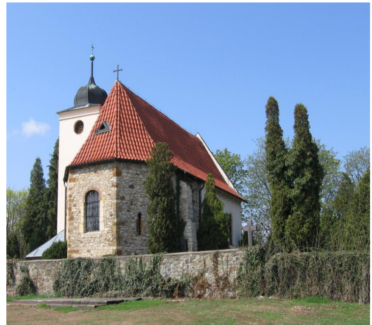
Kostel v Levém Hradci