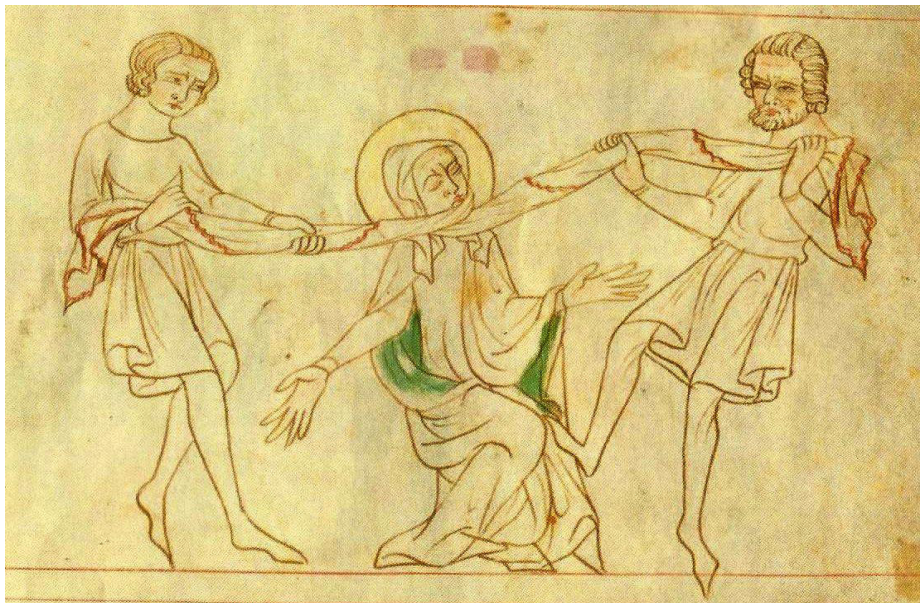
Vražda sv. Ludmily, Velislavova bible

http://1.bp.blogspot.com/-2Cv3dXB8DNY/TnJQ2L-S7xl/AAAAAAAAAKew/9o7lh23_m14/s1600/Ludmila.jpg