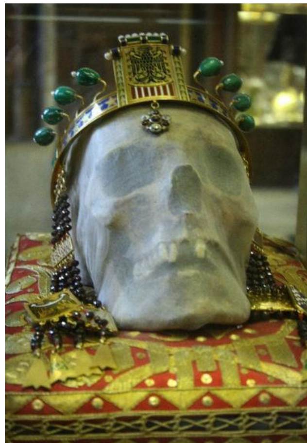
lebka sv. Václava

http://nd01.jxs.cz/635/908/f936a50484_34794514_u.jpg