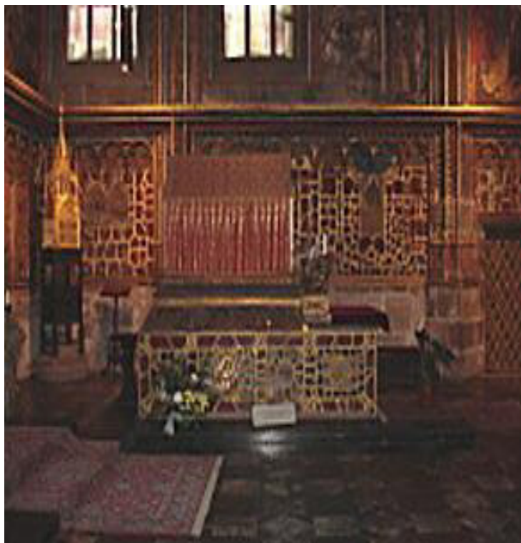
hrobka sv. Václava v chrámu sv. Víta

http://nd01.jxs.cz/635/908/f936a50484_34794514_u.jpg