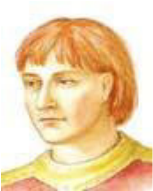
Boleslav I. Ukrutný

http://petanek.org/hrady/pa novnici3/boleslav-l.jpg