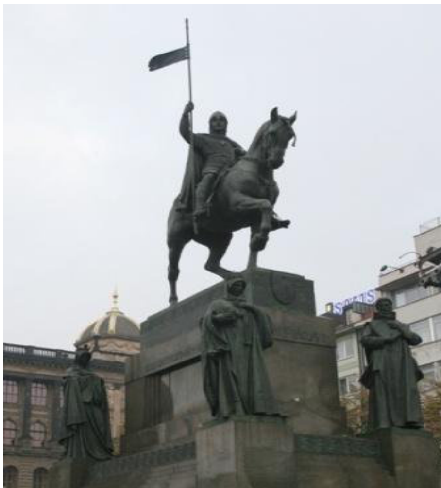
patron Čechů sv. Václav

http://www.monastyrsvgorazda.cz/pic/vaclud.jpg