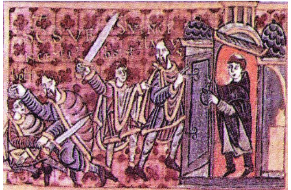
Dobová iluminace zavraždění sv. Václava (Wolfenbúttelský rukopis Gumpoldovy legendy)

http://im.novinky.cz/521/285218-original1-46vk8.jpg