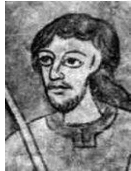
Boleslav I. Ukrutný

http://petanek.org/hrady/pa novnici3/boleslav-l.jpg