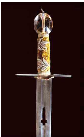
meč sv. Václava

http://www.paranormalactivity.estranky.cz/img/picture/141/mec.jpg