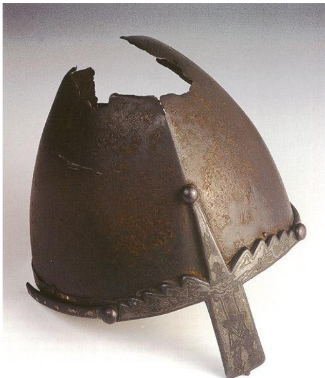
helma sv. Václava , svatováclavský poklad

http://strelci.scherm.cz/utility/Helmice/helm00.jpg