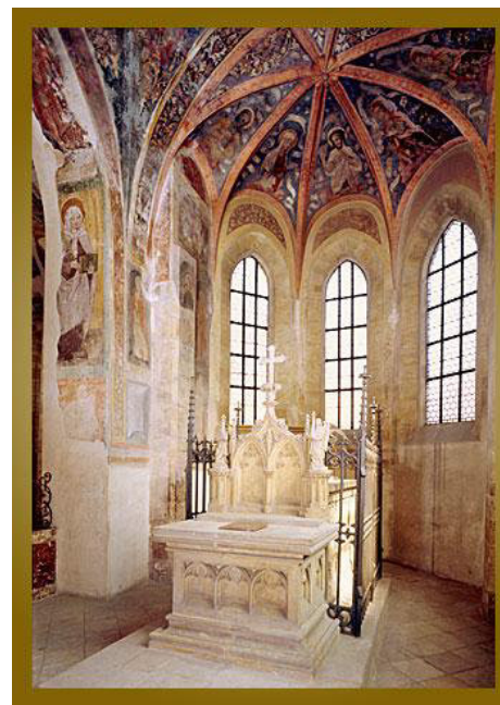
kaple sv. Ludmily