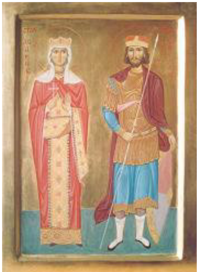
sv. Václav a sv. Ludmila

http://www.monastyrsvgorazda.cz/pic/vaclud.jpg