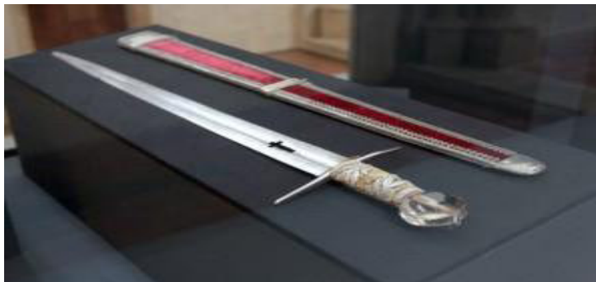
meč sv. Václava

http://strelci.scherm.cz/utility/Helmice/helm00.jpg