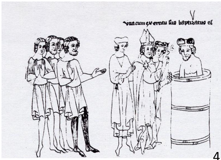
Křest Bořivoje a Ludmily