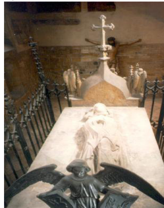
hrob sv. Ludmily na Pražském hradu

http://1.bp.blogspot.com/-2Cv3dXB8DNY/TnJQ2L-S7xl/AAAAAAAAAKew/9o7lh23_m14/s1600/Ludmila.jpg