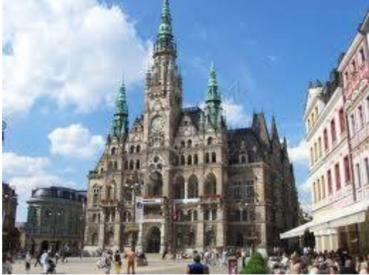
Liberec - radnice