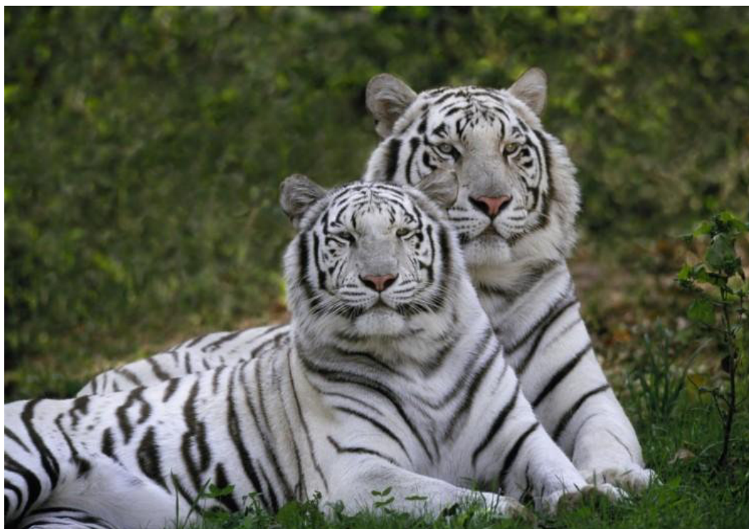
Liberecká ZOO – Bílí tygři