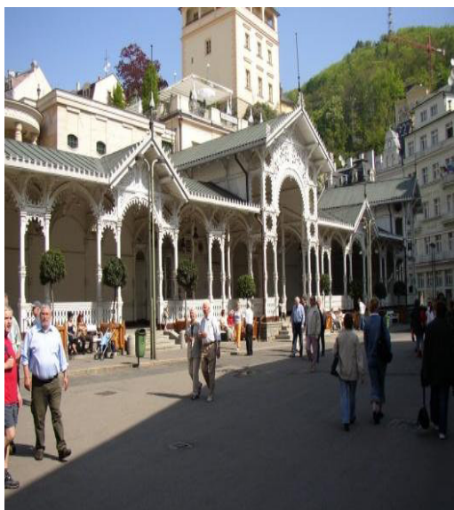
Karlovy Vary - kolonáda