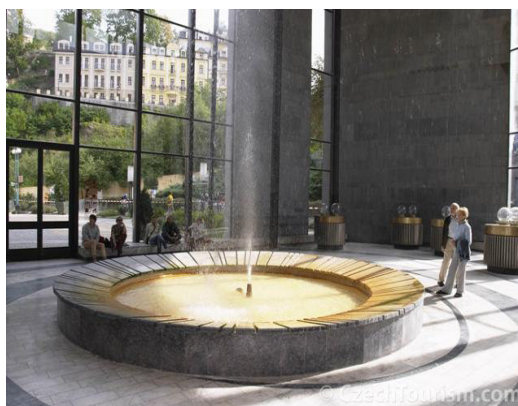
Karlovy Vary -věřidlo

Co vidíš na obrázku? Přiřaď k obrázkům názvy.