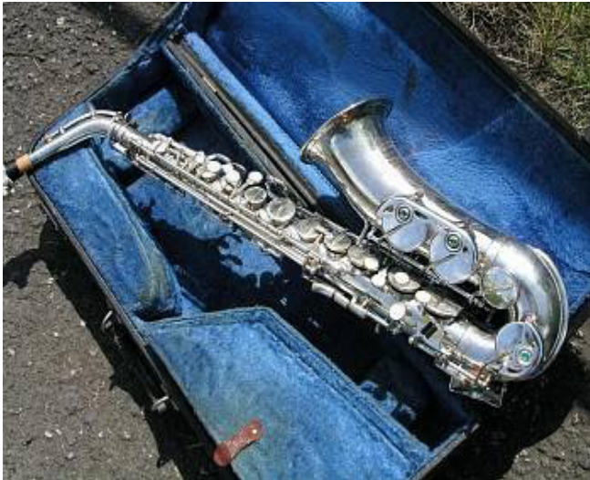
Hudební nástroje z Kraslic