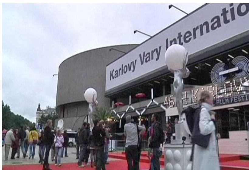
Karlovy Vary – mezinárodní filmový festival