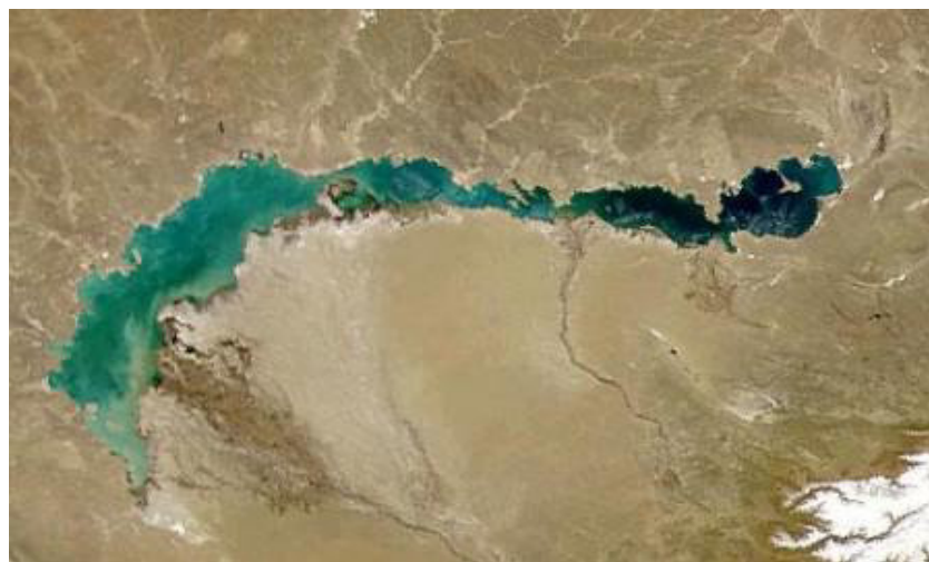
Jezero Balchaš 8