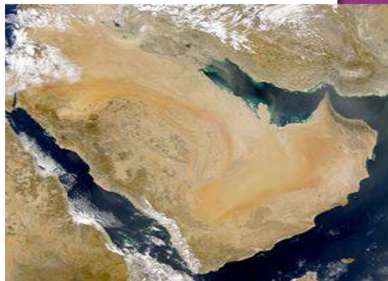
Satelitní snímek Arabského poloostrova 25