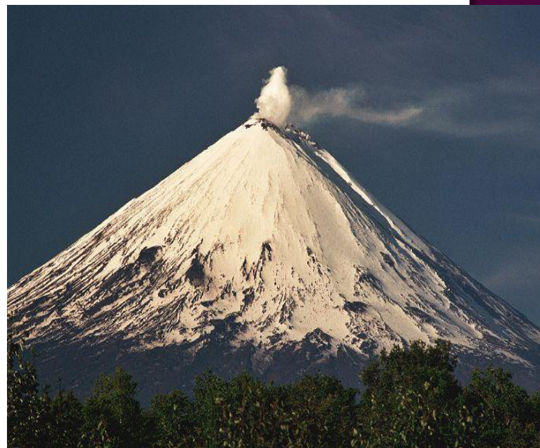
Sopka Ključevskaja 24