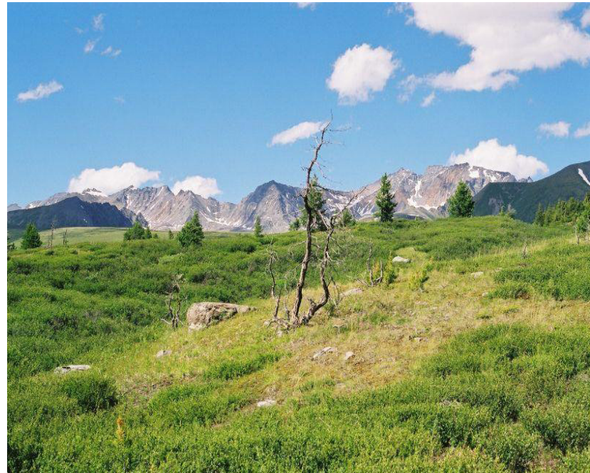
Vysokohorská tundra 18