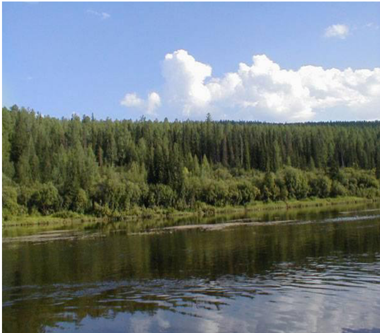
Sibiřská tajga 17