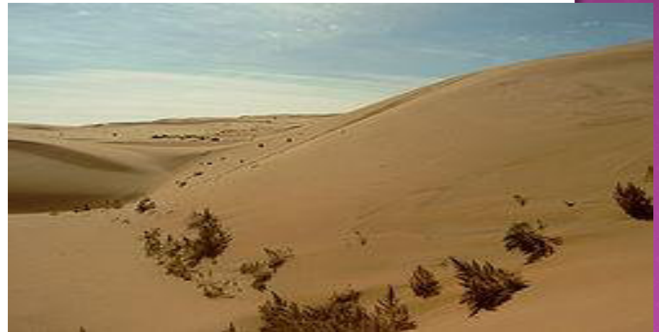
Poušť Gobi 4