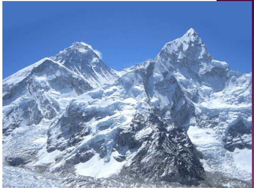
Mount Everest 3