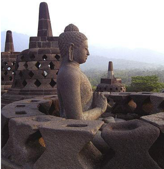
Gautama Buddha 12