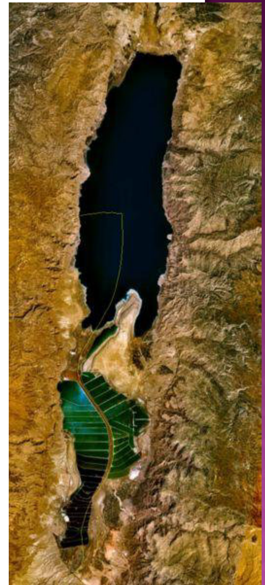
Mrtvé moře, satelitní snímek 22