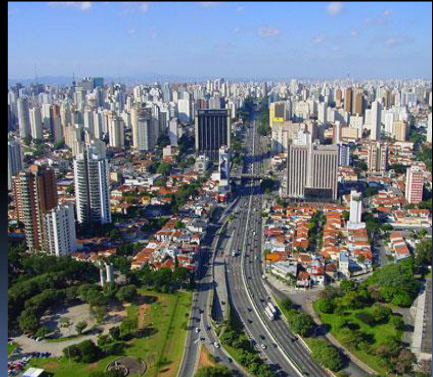
Sao Paulo 25