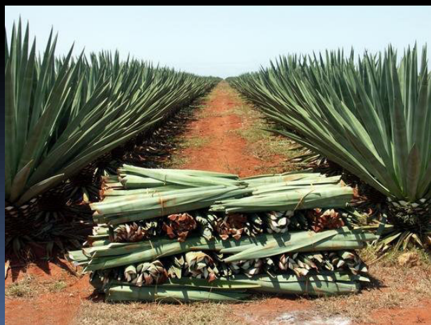
Sisalové pole, Brazílie 21