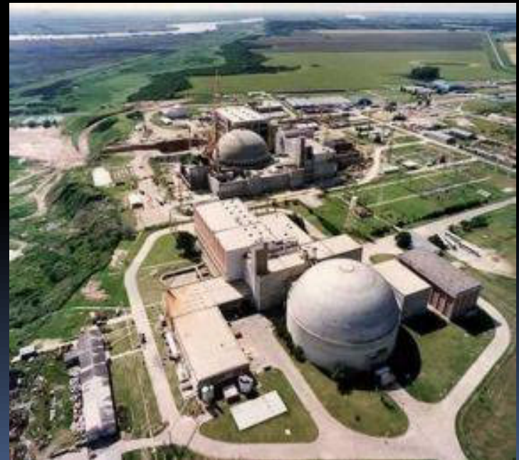
Jaderná elektrárna Atucha II, Argentina 32