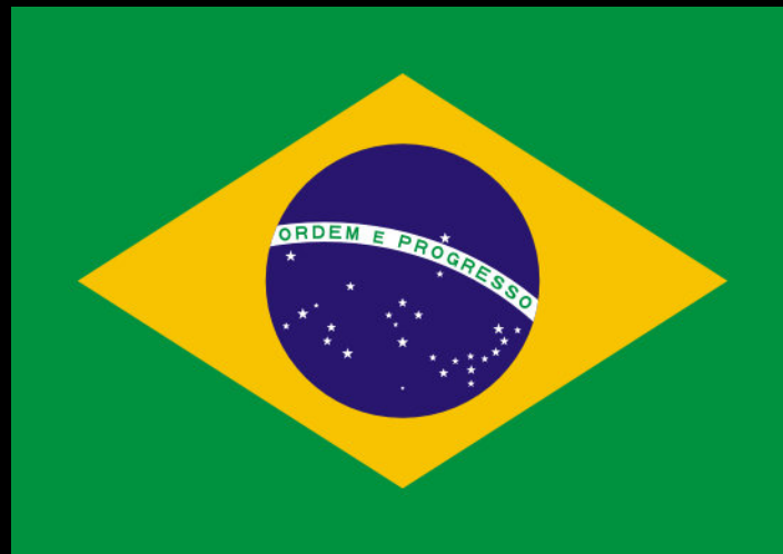
Vlajka Brazílie 18