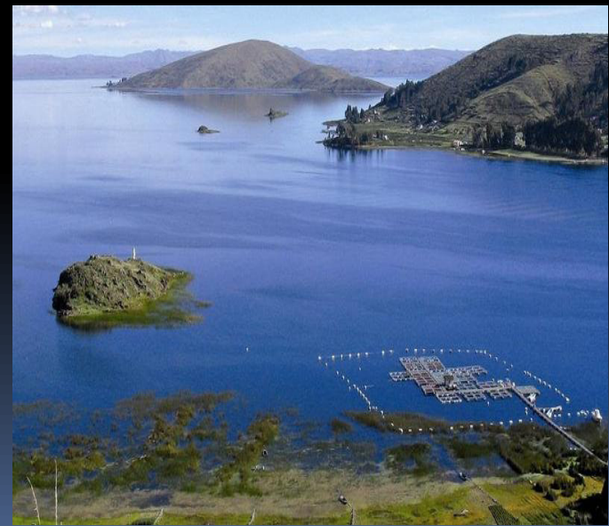
Jezero Titicaca 36