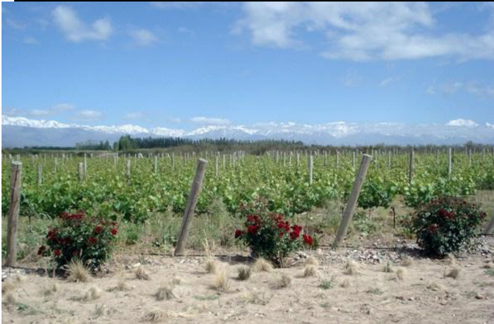
Vinice, Argentina 31