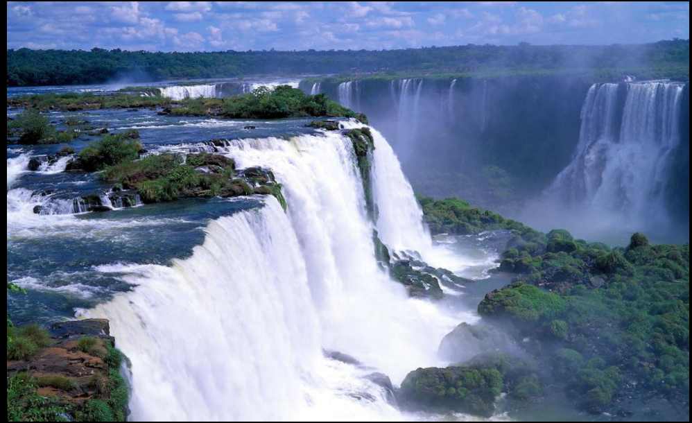
Vodopády Iguazú 37