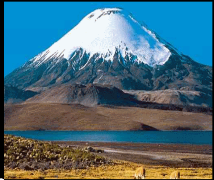
Sopka Ojos del Salado 35