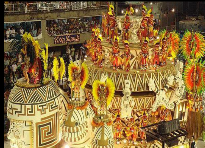
Karneval v Rio de Janeiru