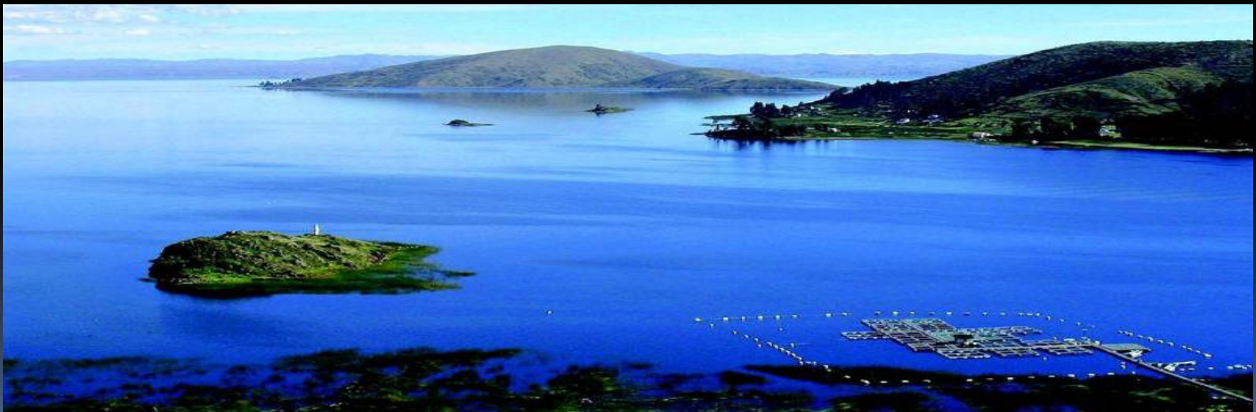
Jezero Titicaca 11