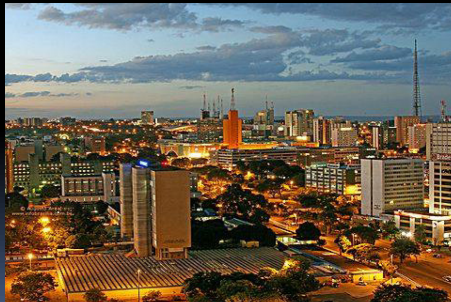
Hlavní město Brasilia