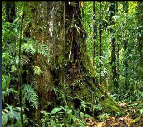
Amazonský deštný prales 39