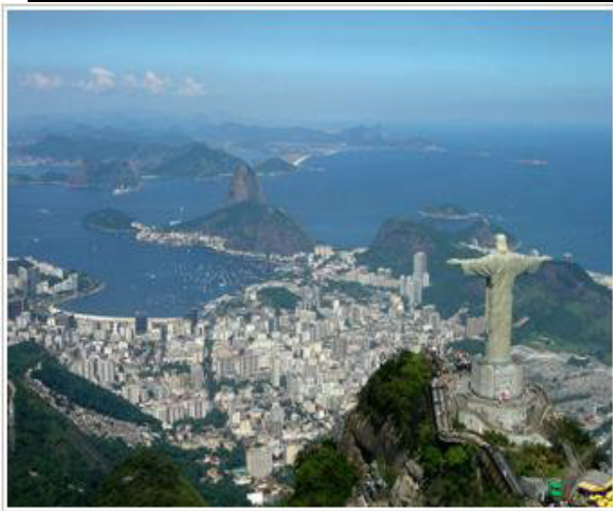
Rio de Janeiro 24