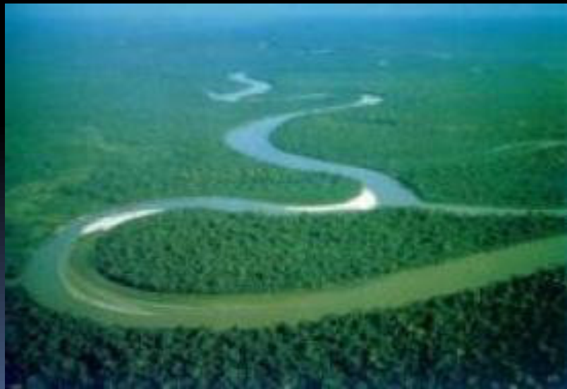
Amazonská nížina 6