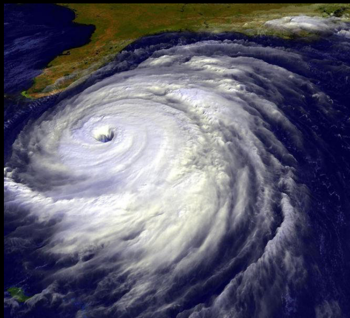
Hurikán Floyd, září 1999