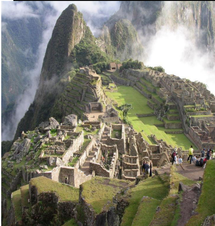
Machu Picchu 38