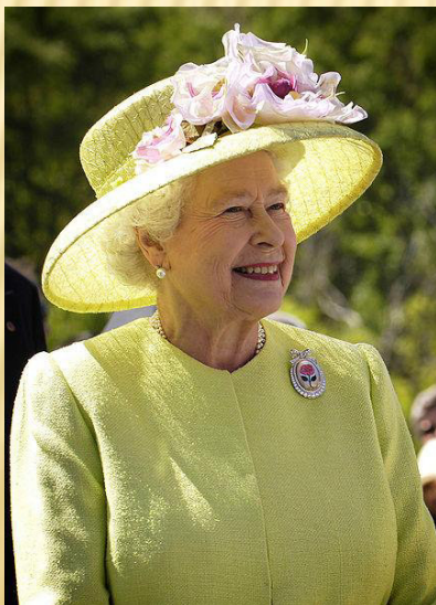
Alžběta II. 12