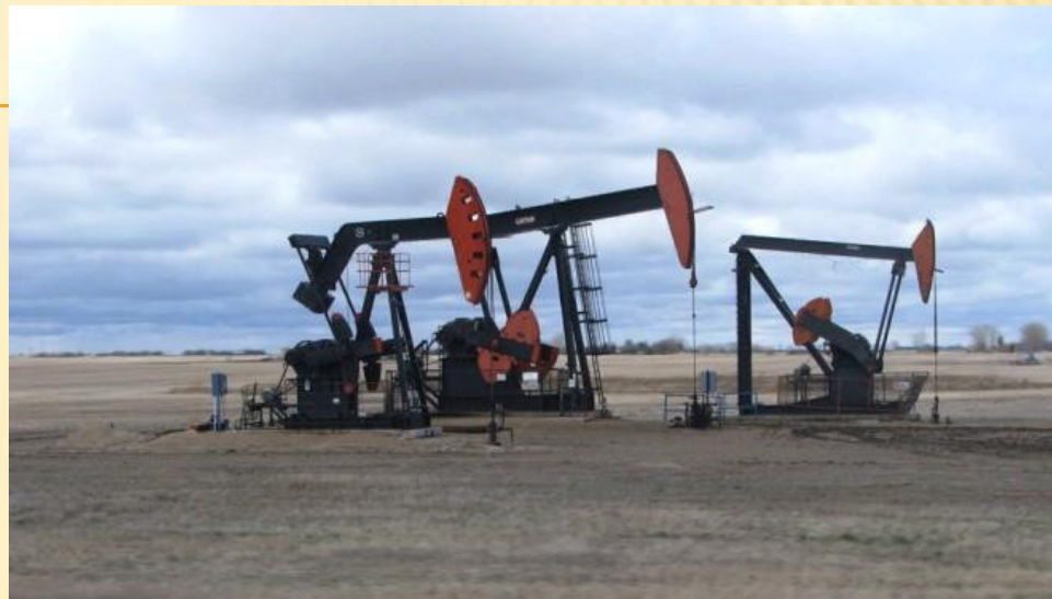
Ropné pole Weyburn, Kanada 16