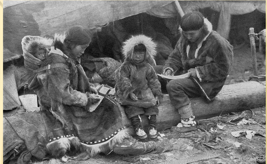
Kanadští Inuité 7