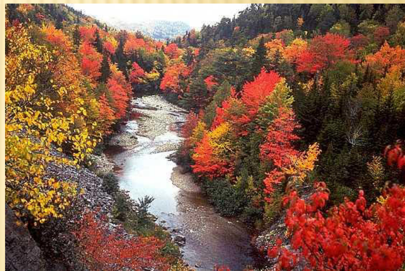
„Indiánské léto“ v Kanadě