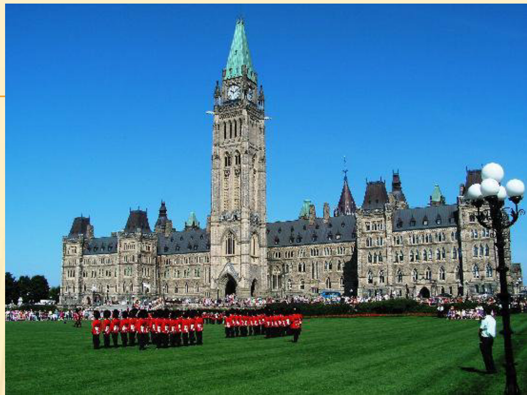
Budova parlamentu, Ottawa 4