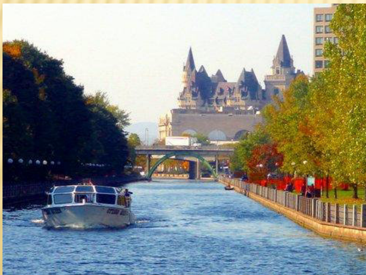
Řeka Rideau - Ottawa 5, 6