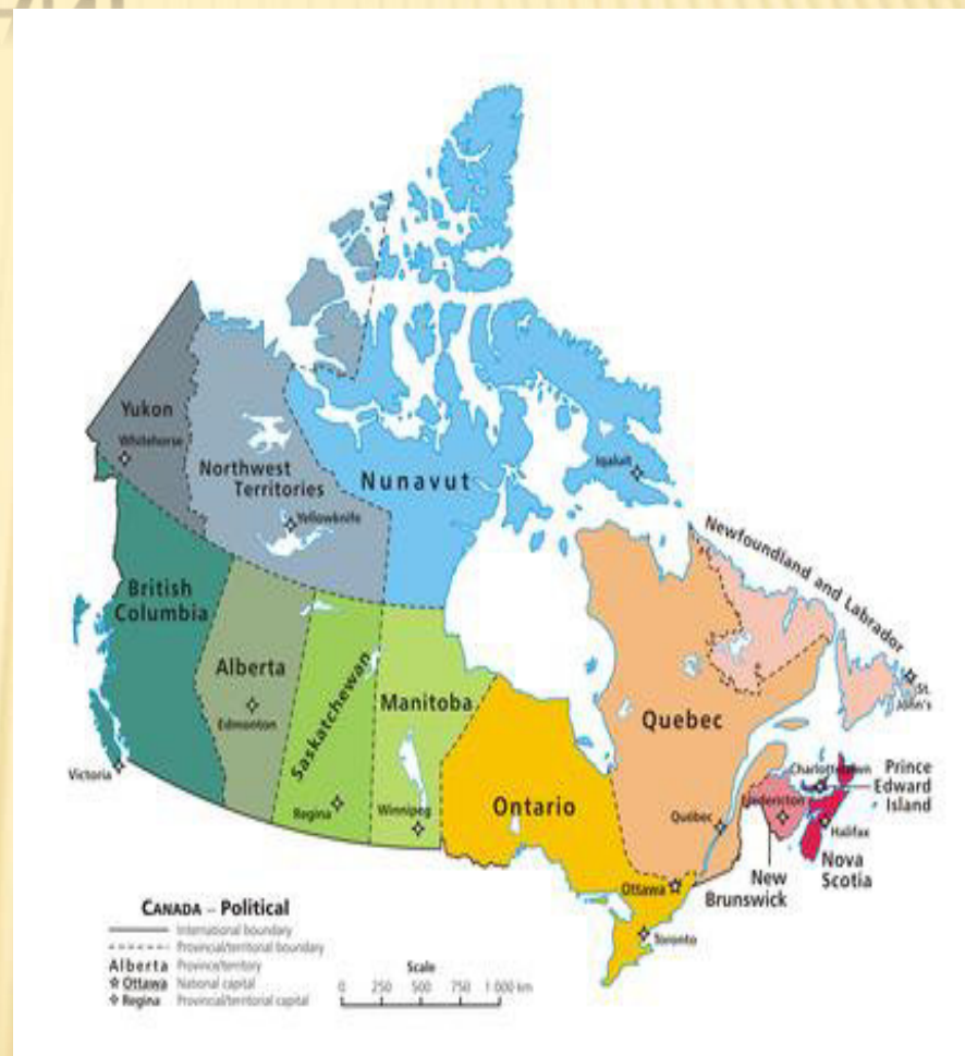
Kanadské provincie a teritoria 11