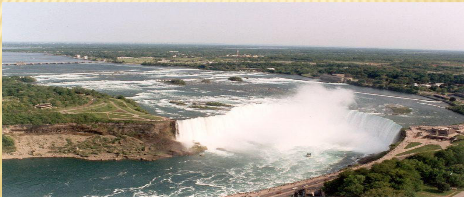
Niagarské vodopády z Kanadské strany