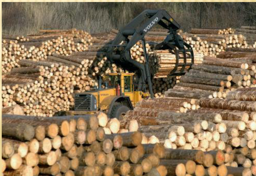
Těžba dřeva 17