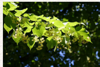
Obr. 28: Lípa malolistá

Národním stromem České republiky je lípa malolistá též srdčitá. Můžeme ji vidět na státních symbolech - vlajka prezidenta, státní pečeť.