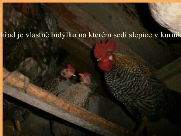
hřad je vlastně bidýlko na kterém sedí slepice v kurníku