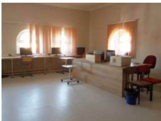
Rekonstrukce počítačové učebny