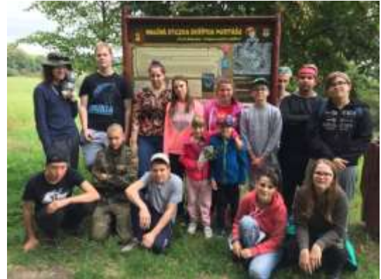
Poznej své okolí