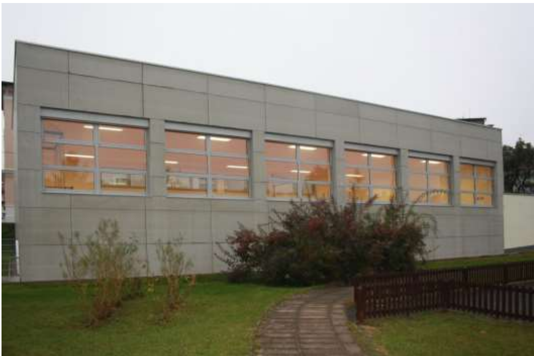
Tělocvična, Šaldova 6, Litoměřice