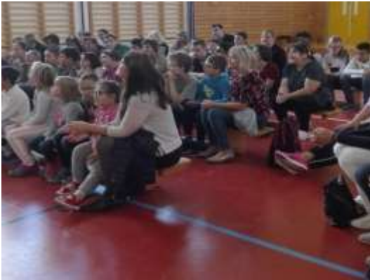
Pohádka „O Koblížkovi“