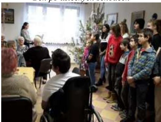
Děláme radost starým lidem