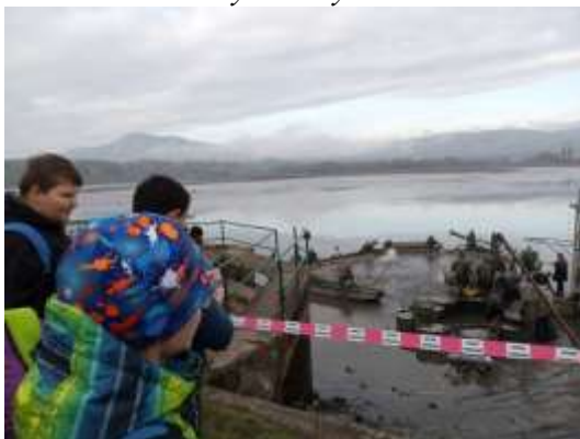
Výlov jezera Chmelař