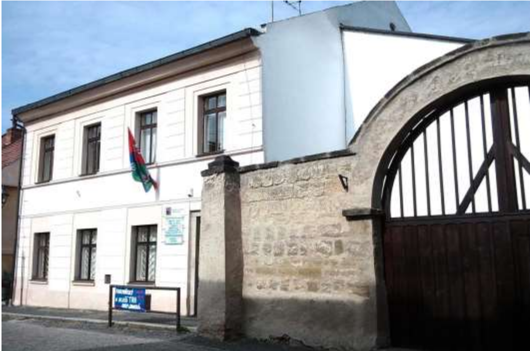
Budova ZŠ praktické, 1. máje 59, Ústěk