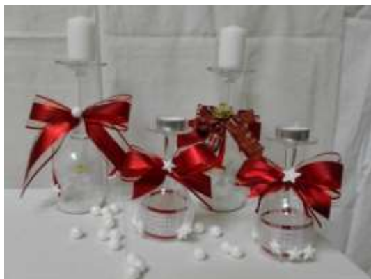
Projektový den „Vánoce“