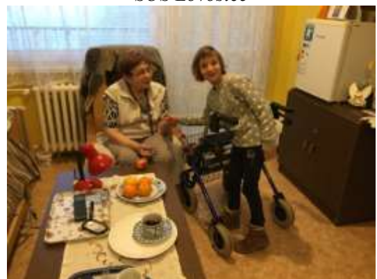
Dářečky do DD Libochovice