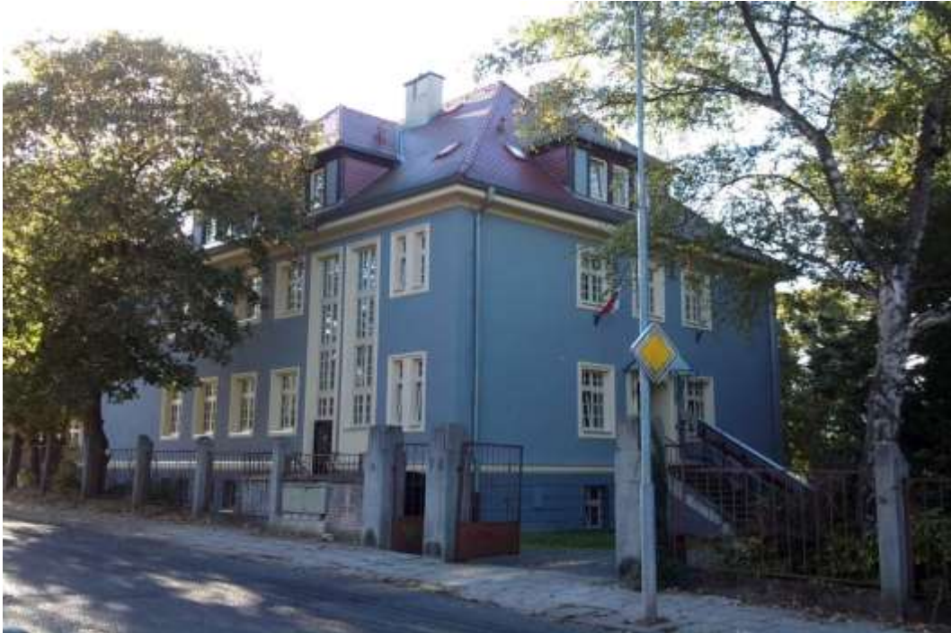
Budova ZŠ speciální SPC, Dalimilova 2, Litoměřice