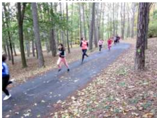
Orientační běh Mostnou horou