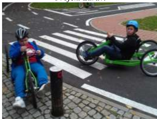
Projekt Bezpečně na kole