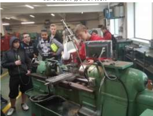
Exkurze do SOU a SOŠ Roudnice n/L