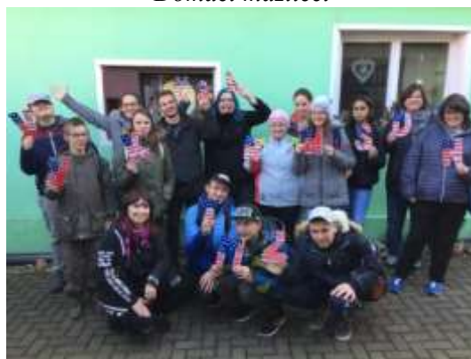
Přednáška o USA