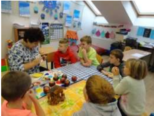
Projektový den Vánoce