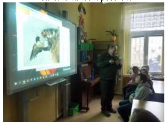
Povídání s pánem lesa