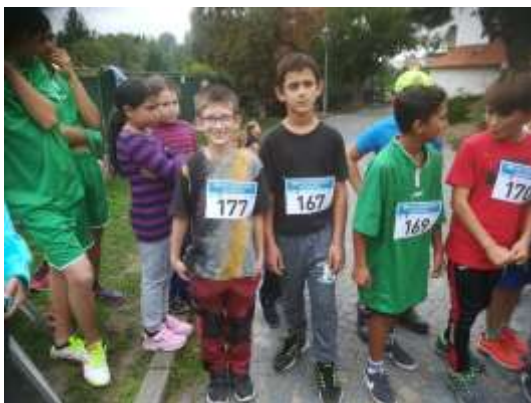
Běh po ústředkých schodech