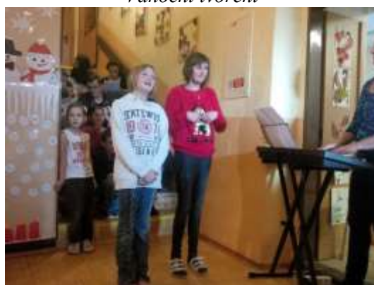
Zpívání na schodech