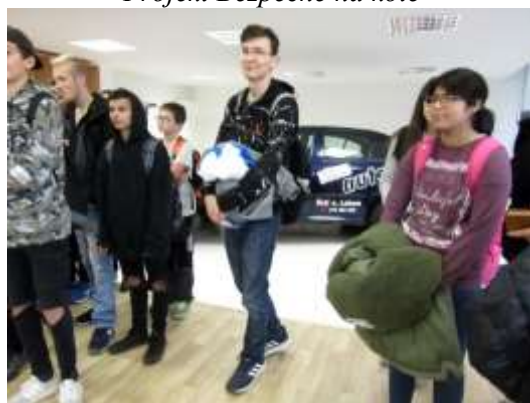
Exkurze do SOU a SOŠ Roudnice n/L