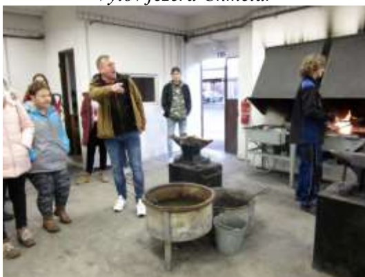
Exkurze do SOŠ Lovosice