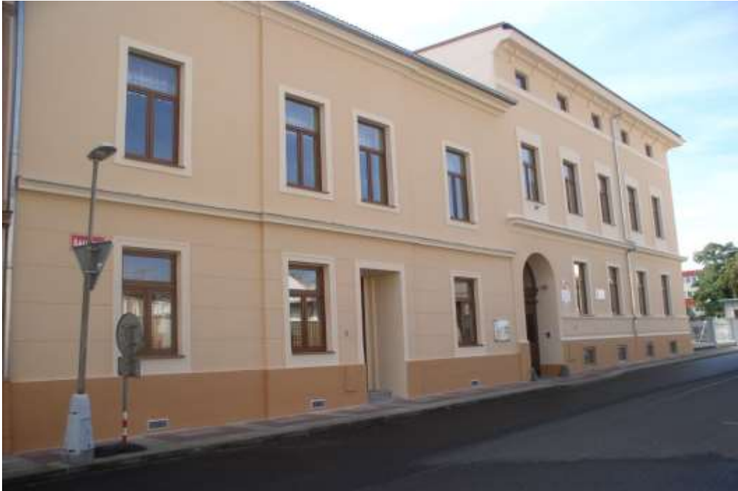
Budova ZŠ praktické a Praktické školy dvouleté, Šaldova 6, Litoměřice