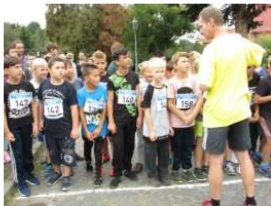
Běh po úštěckých schodech