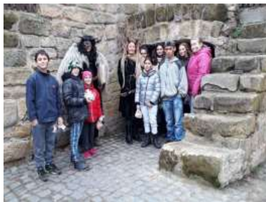
Muzeum čertů s nadílkou