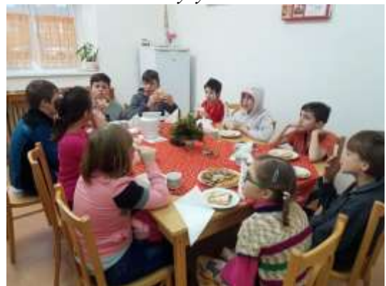
Kouzelné vánoční posezení