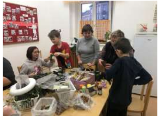
Vánoční zvyky a tradice I.