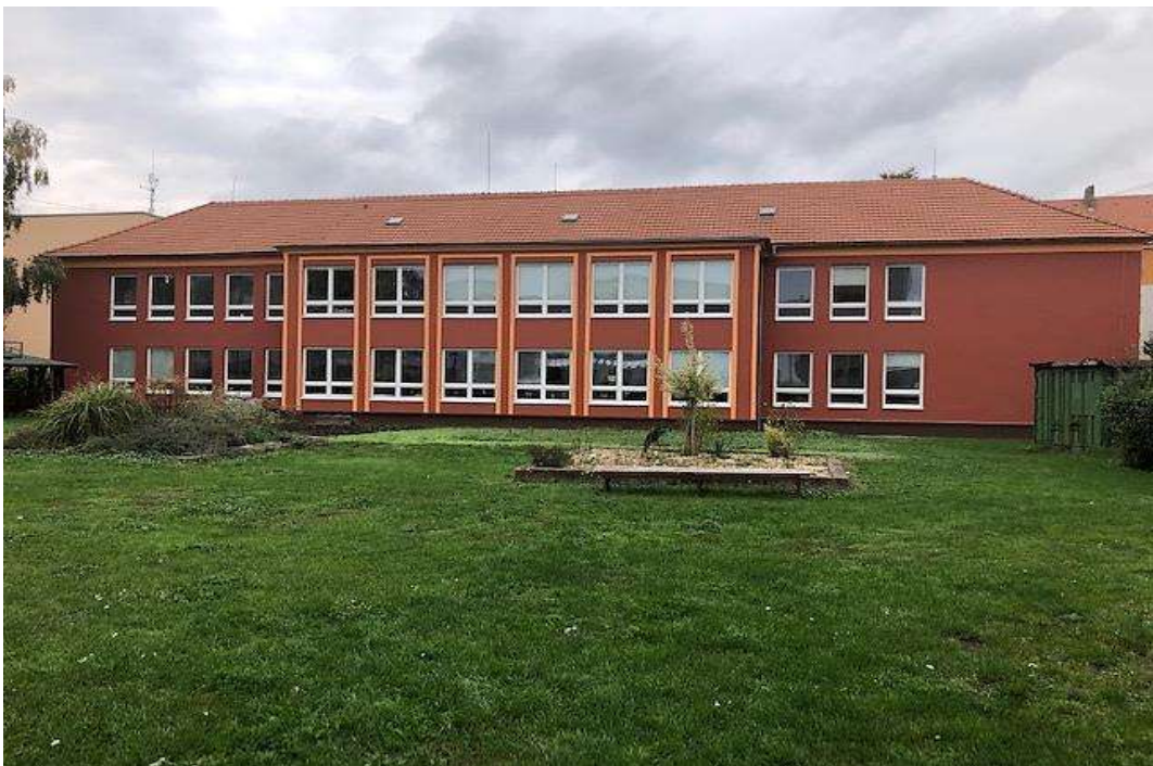
Budova ZŠ praktické, Mírová 225, Lovosice