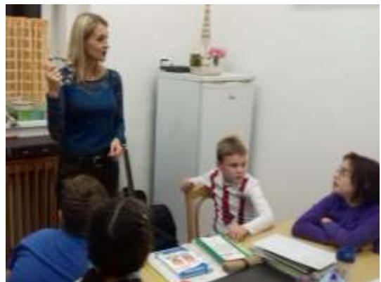
Hudba a my