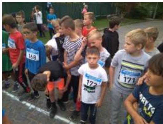
Běh po úštěckých schodech