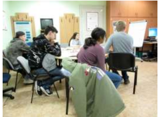
Exkurze do IPS ÚP Litoměřice