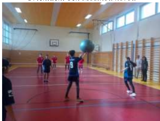
Turnaj v Bumbác ballu