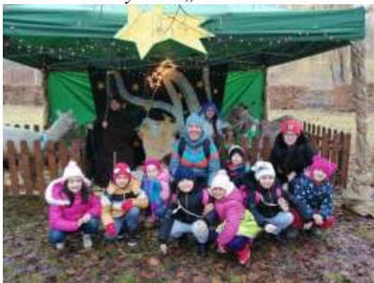
1. pololetí 1. třídy