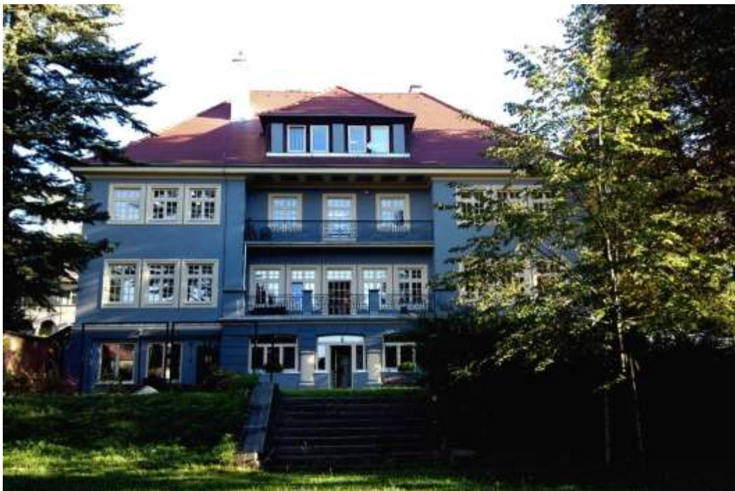
Budova ZŠ speciální SPC, Dalimilova 2, Litoměřice (pohled ze zahrady)