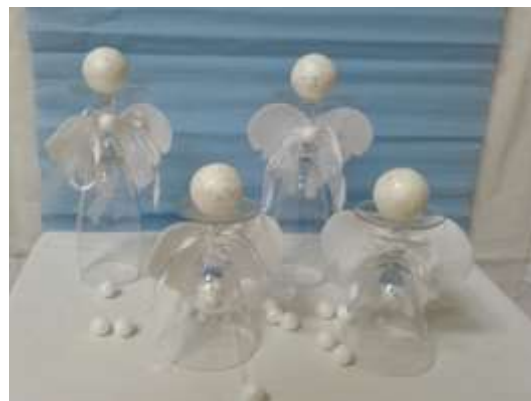
Projektový den „Vánoce“