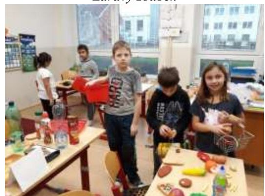
Hrajeme si na obchod