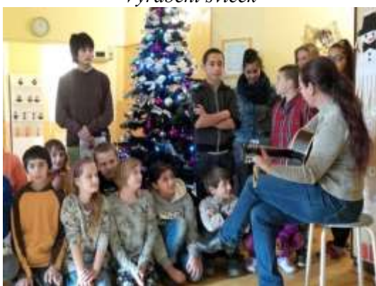
Rozsvěcení vánočního stroměčku