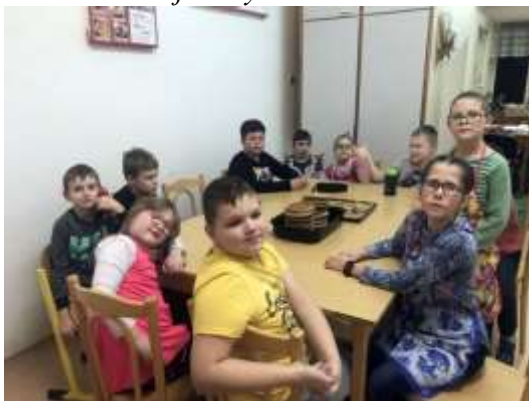
Vánoční zvyky a tradice II.